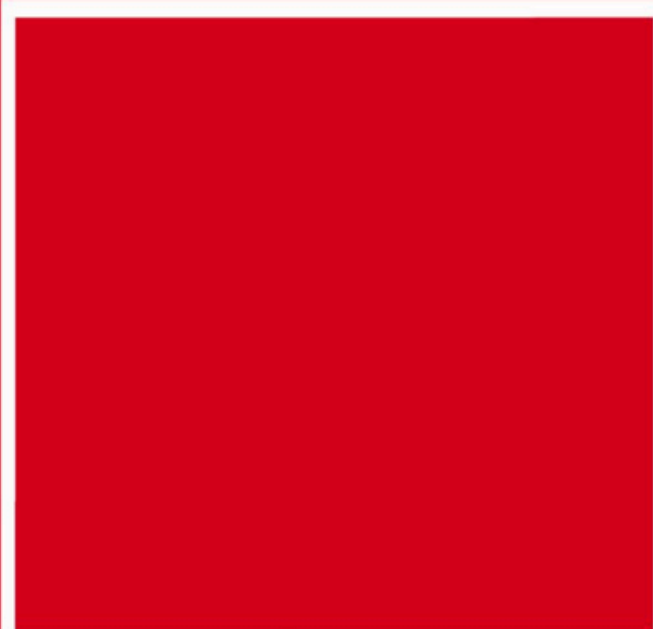
PANTONE® PMS 2035 C # D6001C